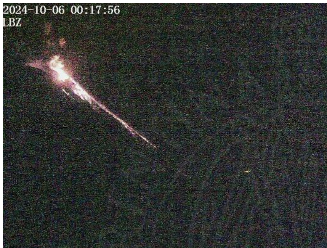
Fig.2 Immagine dell'evento sopradescritto, ripreso dalla telecamera visibile LBZ