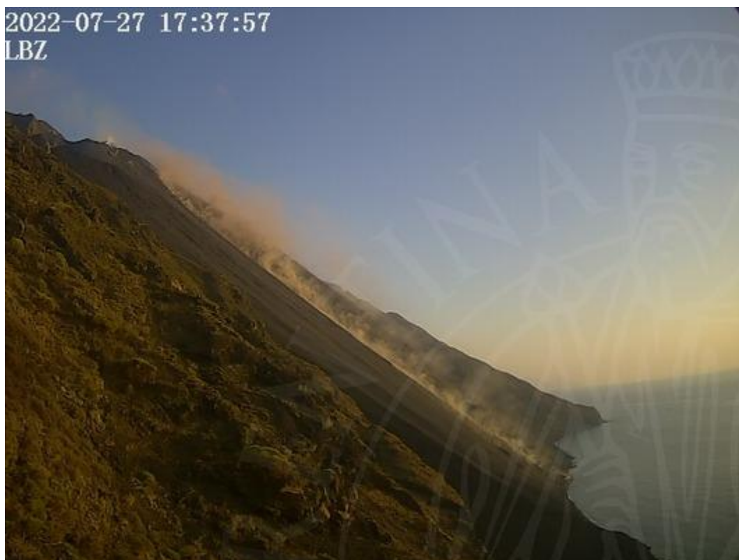
Figura 1: Immagine dalla telecamera a Punta Labronzo, delle 17:37 UTC

Si segnala che è in corso un piccolo trabocco lavico dall'area craterica Centrale (Figura 1), accompagnato da un modesto aumento del tremore alle ore 17:04 UTC (Figura 2) e da una debole deflazione del suolo (Figura 3). Non ci sono al momento ulteriori variazioni dei parametri monitorati. L'attività esplosiva è attualmente nella norma e l'indice di attività si mantiene sul livello MEDIO.