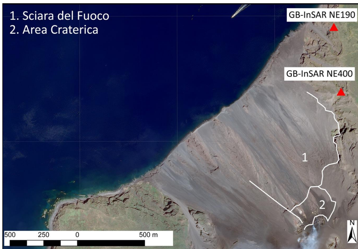
Figura 1 - Mappa dei settori monitorati mediante i sistemi radar GBInSAR NE190 e GBInSAR NE400.