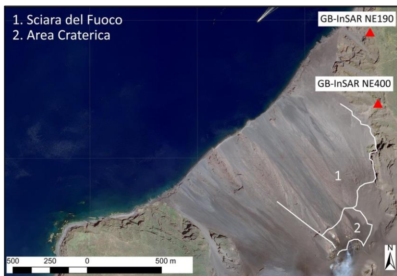
Figura 1 – Mappa dei settori monitorati mediante i sistemi radar GBInSAR NE190 e GBInSAR NE400.